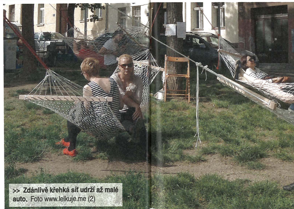
>> Zdánlivě křehká síť udrží až malé auto. Foto www.lelkuje.me (2)

A v čem jsou podle ní sociální síť lepší než ty z běžného obchodu? „Koupí té naší dostávají i příběh. Dáváte vědět člověku, který ji pro vás upletl, že má cenu žít normálně. On má šanci dě-